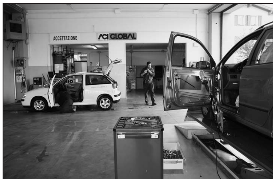
Elettrauto - Officina meccanica - Gommista - Diagnosi computerizzata - Ricarica condizionatori - Tagliando in giornata