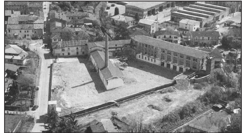
MONTICHIARI. La Filanda in demolizione. Un glorioso periodo di storia montecolarese chiuso definitivamente, da quando l'attività cessò nel 1968. Resta la ciminiera con l'edificio più antico.

primi di maggio e i preziosi “animaletti”, delicatissimi, avevano bisogno per i sette giorni della prima muta di una temperatura di 22 gradi (poi ne sarebbero bastati 18/19). Si portavano quindi subito in cucina, l'unica stanza riscaldata di tutta la casa, dove la stufa doveva ardere anche di notte. La stufa l'aveva costruita nostro padre, in buoni mattoni, dopo aver acquistato la piastra in ghisa con la vaschetta dell'acqua in lamiera cromata.