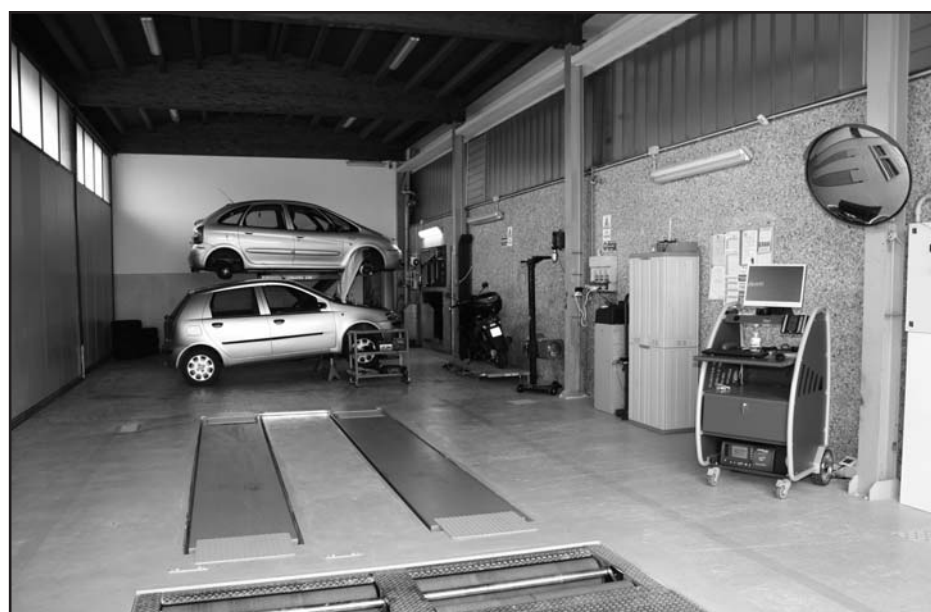
Nuovo centro revisioni, tutti i giorni senza prenotazione - Moto - Quad - Auto - Furgoni fino 35 q.

030.962501 IL TELEFONO AL TUO SERVIZIO 24 ORE SU 24