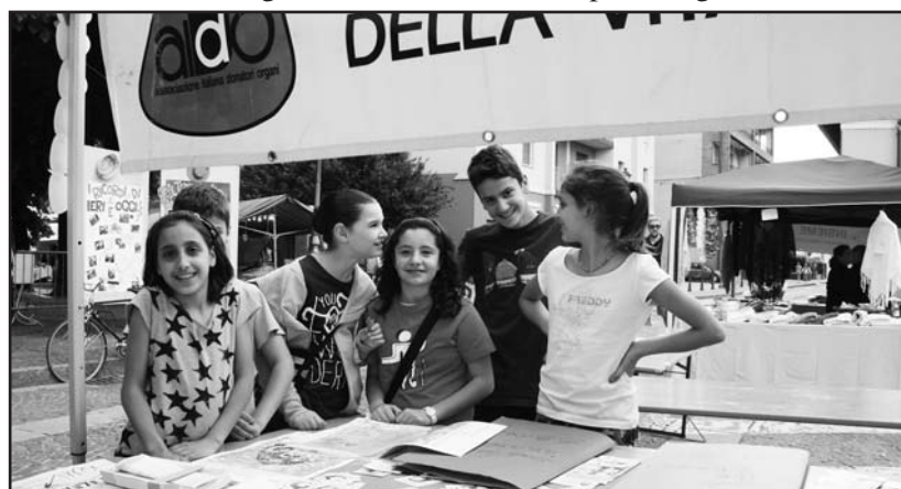
Ragazzi mentre osservano i disegni della Borsa di Studio "Cristian Tonoli".

Per ulteriori informazioni la segreteria avis è aperta il sab mattina dalle 10 alle 12 all'ingresso ospedale tel. 030 9651693. Nella stessa palazzina la sede aido è aperta il sab mattina dalle 10 alle 11 tel. 335 6551349.