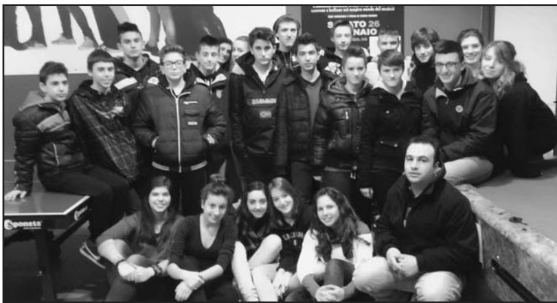
I protagonisti del musical.

Lo stesso Boldini ricorda come "non sia stato facile mettere in scena una commedia musicale così impegnativa, basti considerare solamente l'elevato numero di protagonisti: abbiamo passato tante sere a provare e riprovare, ma in tutti c'è stata molta voglia di divertirsi tra una canzone ed un balletto, tra una recitazione ed una scenografia ed alla fine ciò che conta è aver lavorato con piacere e divertimento. La costanza di due