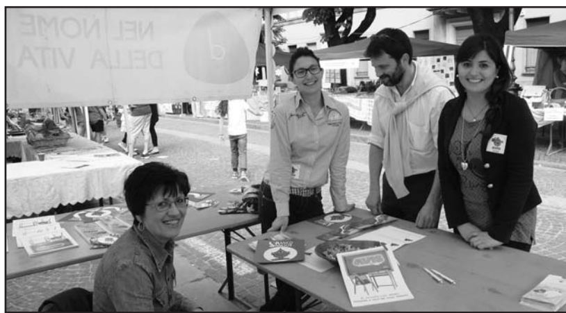
Il Presidente Avis con le sue collaboratrici.

Molto azzeccata l'iniziativa dell'Avis e dell'Aido di presenziare con un gazebo informativo durante la fiera di San Pancrazio. L'alternarsi di varie persone preparate, dai più giovani ai veterani, che hanno piacevolmente dato le primarie informazioni ai passanti interessati per entrambe le associazioni e omaggiato di simpatici gadget, ha fatto sì che queste due giornate siano davvero servite a far conoscere ad un maggior numero di possibili donatori questi due mondi della donazione. Per quanto riguarda l'Avis si punta soprattutto all'iscrizione di nuovi donatori giovani per garantire un giusto ricambio generazionale e una lunga continua-